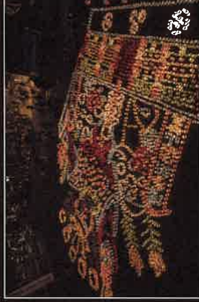
▲ 去年の灯明地上絵の様子