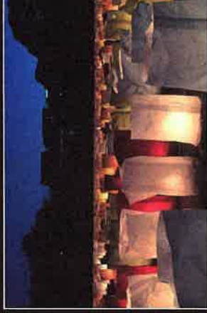
▲ 去年の灯明地上絵の様子