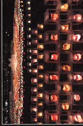
▲ 去年の灯明地上絵の様子

ラゾビエールドカッタ2019年10月20～11月2で福岡県・福岡市をはじめとした全国2都市で開催することを記念し、公式マスコットの「レンジー」を描きます。ラゾビエールと仲間たちの祭典を祝う、世界へ向けた灯明作品です。 【問合せ先】 ☎ 092-431-8484 [ラゾビエール] 博多3Fインテグレーション