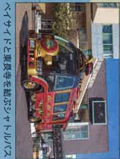
ヘイサイドと東長寺を結ぶシャトルバス